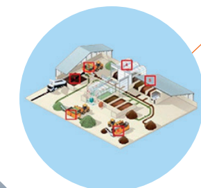
Schéma directeur de valorisation des boues urbaines et des biodéchets Rennes Métropole (35) (2016-2018)

Extension de la station d'épuration de Guidel - Lorient Agglomération (56) (2014-2018)