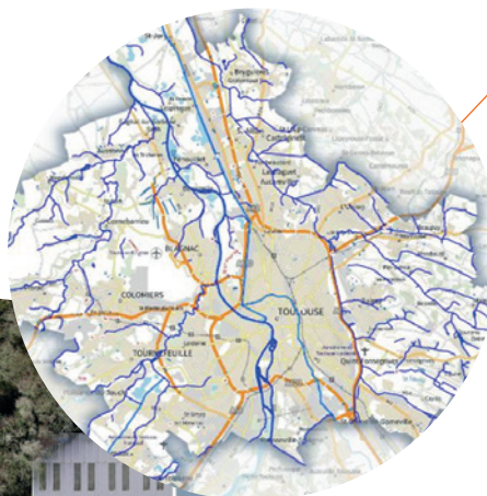
Schéma directeur des eaux pluviales de Toulouse Métropole (31) (2022-2026)

Schéma directeur de valorisation des boues urbaines et des biodéchets Rennes Métropole (35) (2016-2018)